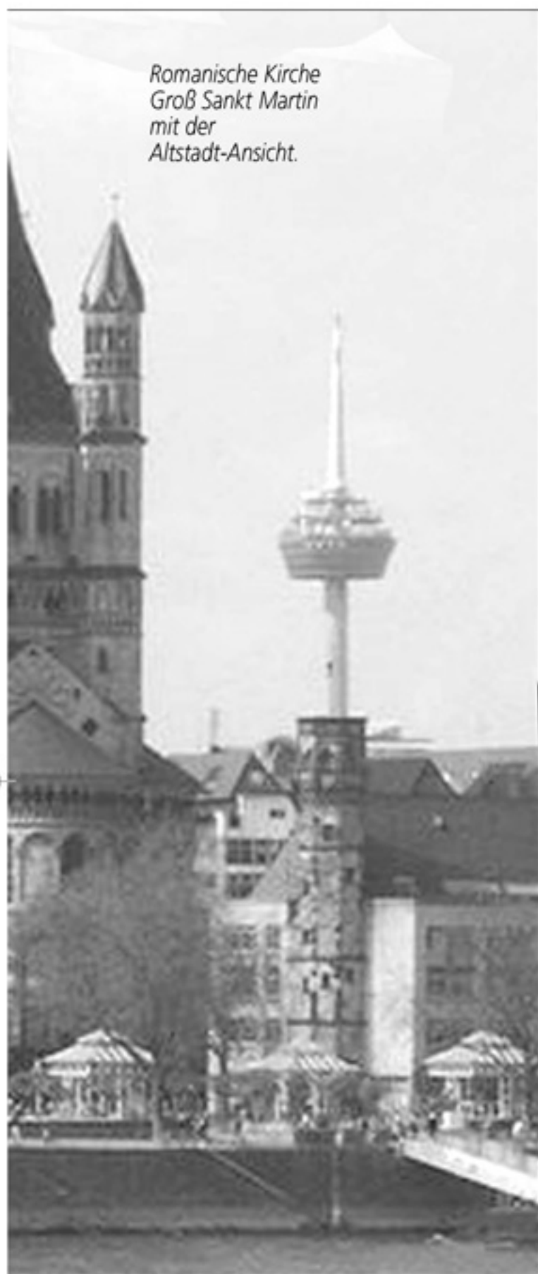
Romanische Kirche Groß Sankt Martin mit der Altstadt-Ansicht.

mich in den unterirdischen Gewölben der Domschatzkammer umzusehen und die ausgestellten sakralen Kost-